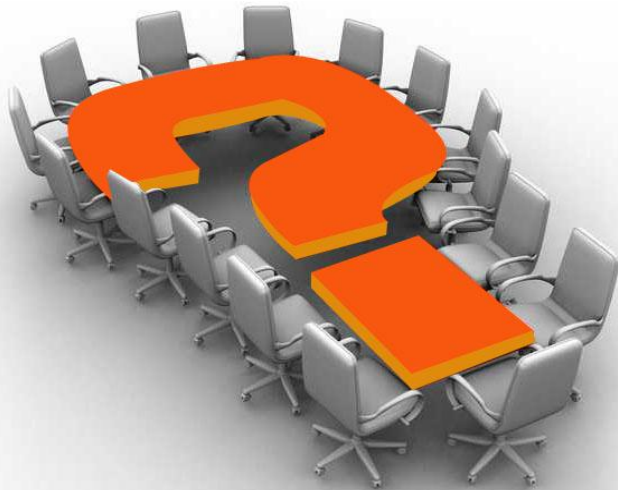
Imagen adaptada - Oracle Corp.